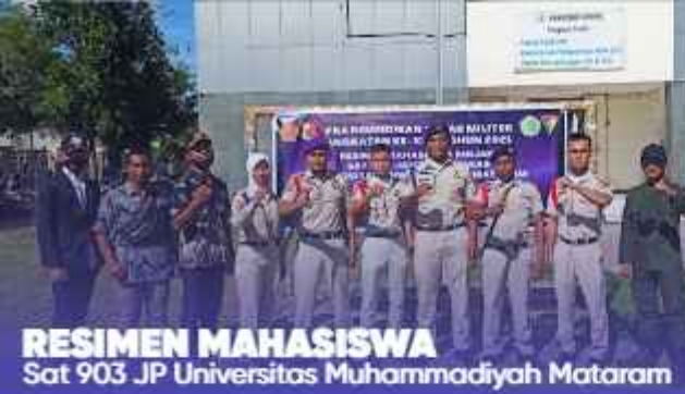
RESIMEN MAHASISWA Sat 903 JP Universitas Muhammadiyah Mataram