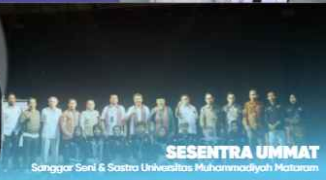
SESENTRA UMMAT Sanggar Seni & Sastra Universitas Muhammadiyah Mataram