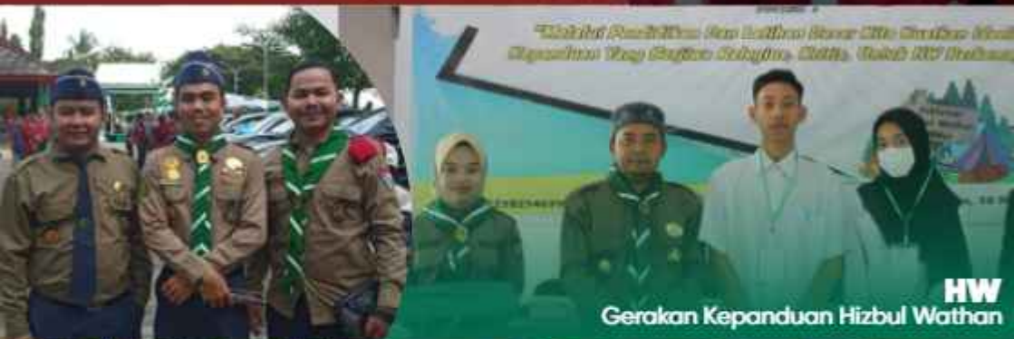
HW Gerakan Kepanduan Hizbul Wathan