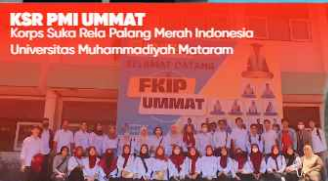
KSR PMI UMMAT Korps Suka Rela Palang Merah Indonesia Universitas Muhammadiyah Mataram