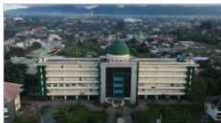
Picture: Universitas Muhammadiyah Mataram located at Jalan KH. Ahmad Dahlan No. 1, Pagesangan Mataram, West Nusa Tenggara Province, Indonesia.

Picture: Mandalika International Street Circuit has hosted several world-class racing events including Asia Talent Cup, World Superbike (WSBK), as well as MotoGP.