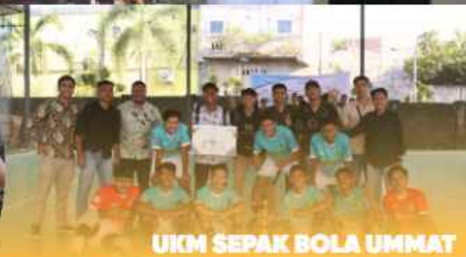
UKM SEPAK BOLA UMMAT