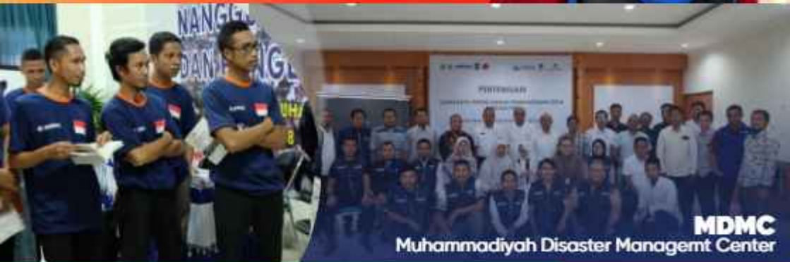
MDMC Muhammadiyah Disaster Managemnt Center