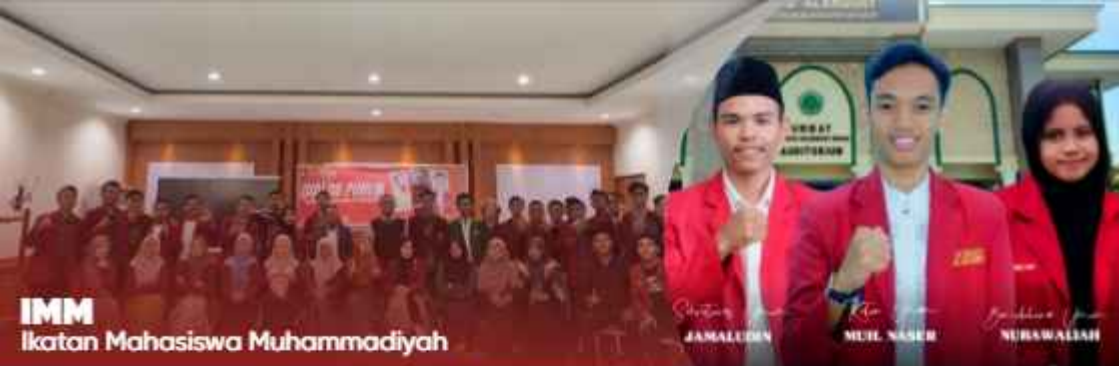
IMM Ikatan Mahasiswa Muhammadiyah