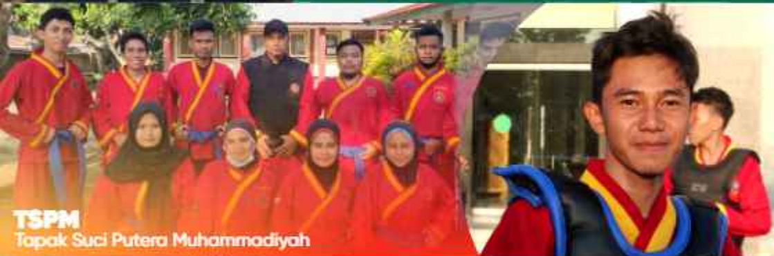
TSPM Tapak Suci Putera Muhammadiyah